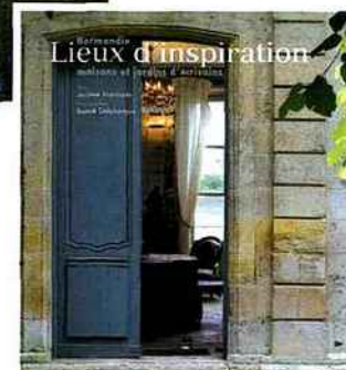
Hauteville House, la maison d'exil de Victor Hugo à Guernesey.