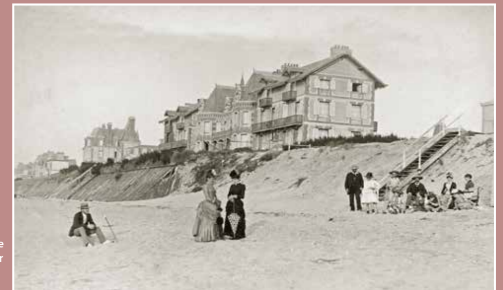
Les premières villas de la nouvelle station balnéaire sont édifiées sur la dune, à l'est du casino, au bord même de la plage.