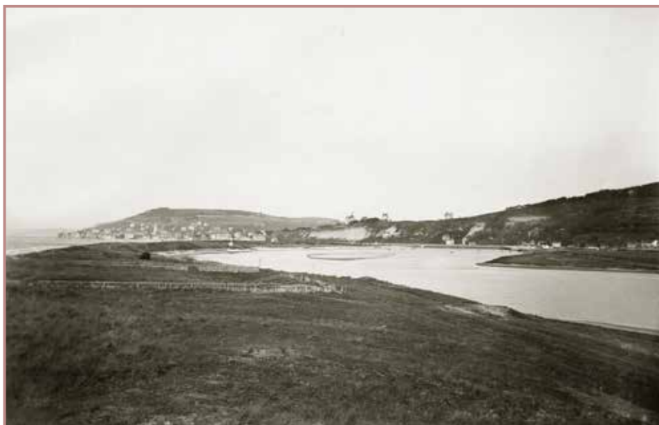
La Pointe de Cabourg vers 1865.

vannes régulant le niveau des eaux et drainant cette immense zone humide, la transformant en de multiples et gras herbages d'embouche.