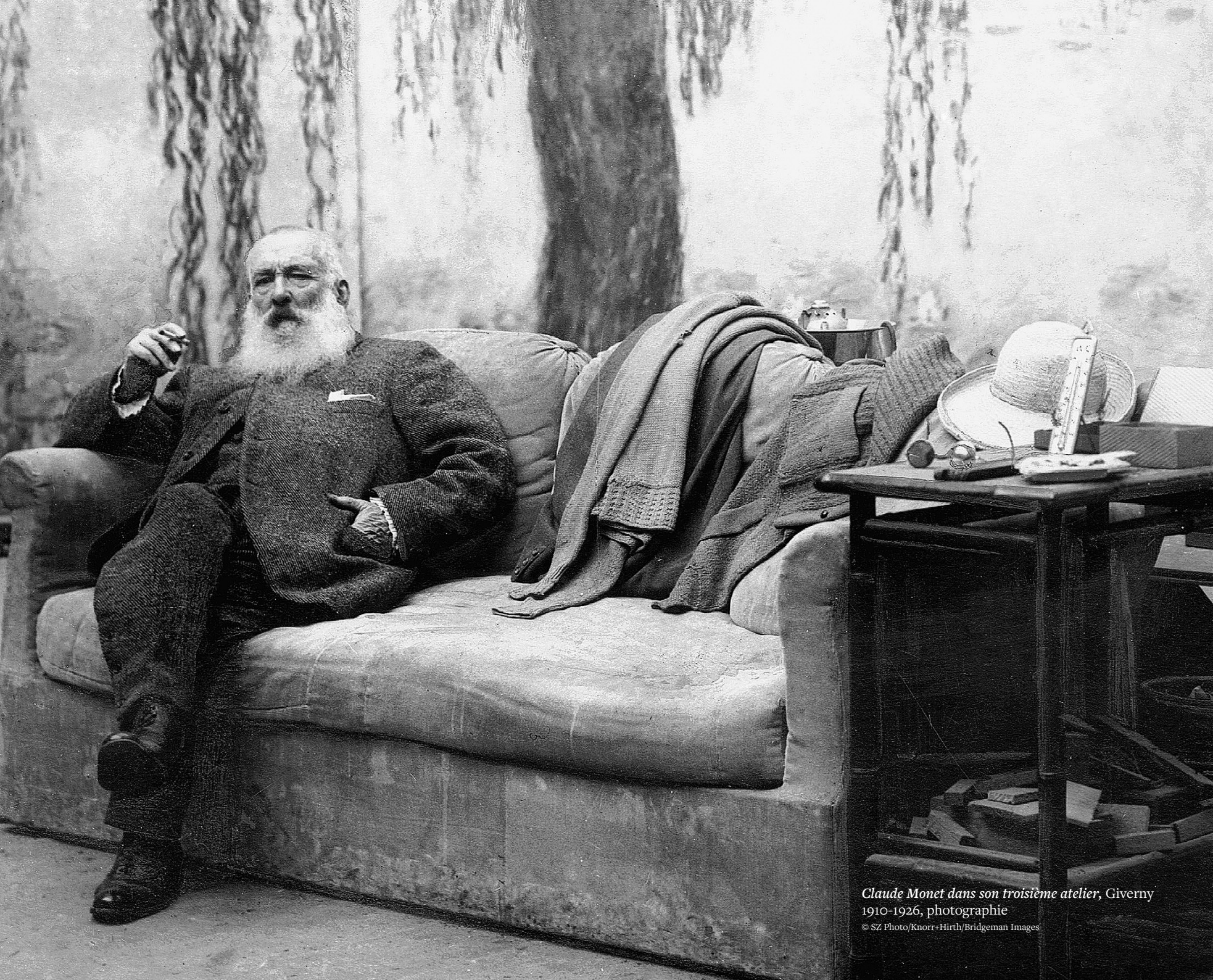
Claude Monet dans son troisième atelier, Giverny 1910-1926, photographie