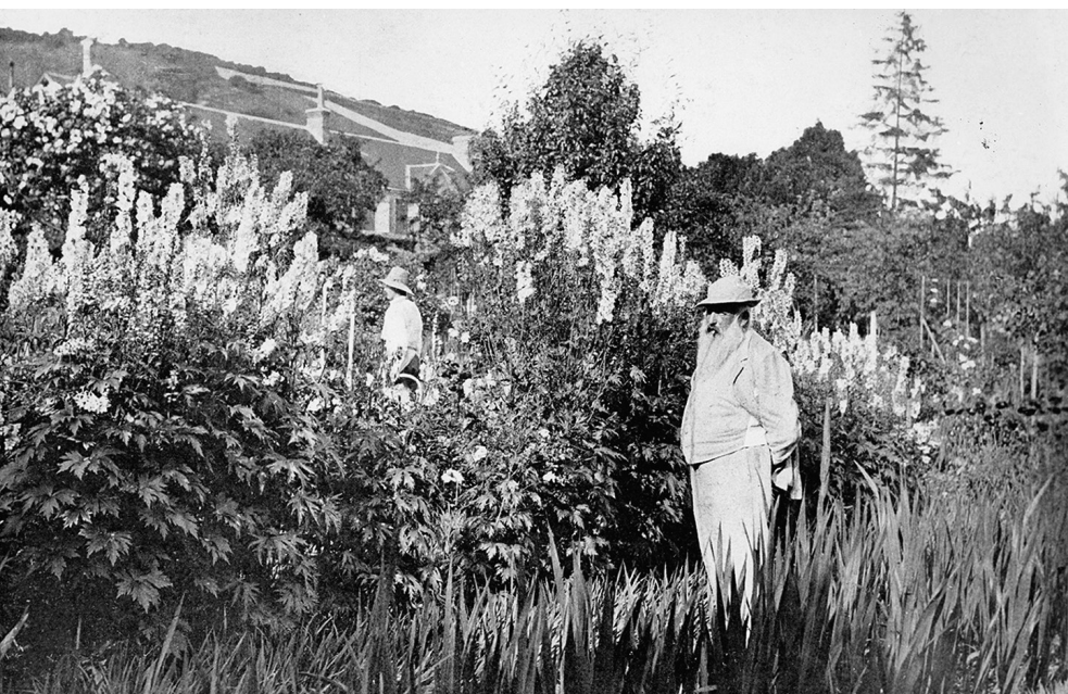
Claude Monet dans son jardin, Giverny, 1908 Paris, bibliothèque des Arts décoratifs © Archives Charmet/Bridgeman Images